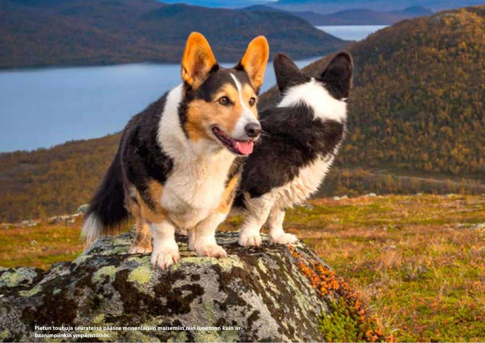
Pietun touhuja seurattessa pääsee monenlaisiin maisemiin niin luontoon kuin urbaanimpiinkin ympäristöihin.

Puheliaampi Pietu esittelee kuvissa usein laulunlahjojaan ja onpa se corgimaiseen tapaan välillä pikkuisen komentelevainenkin. Eetu taas on hyvin ilmeikäs koira ja esimerkiksi sen ujestelu perheen Oliver-kukon seurassa on paitsi viihdyttävää myös koiran elekielen kannalta opettavaista katsottavaa.