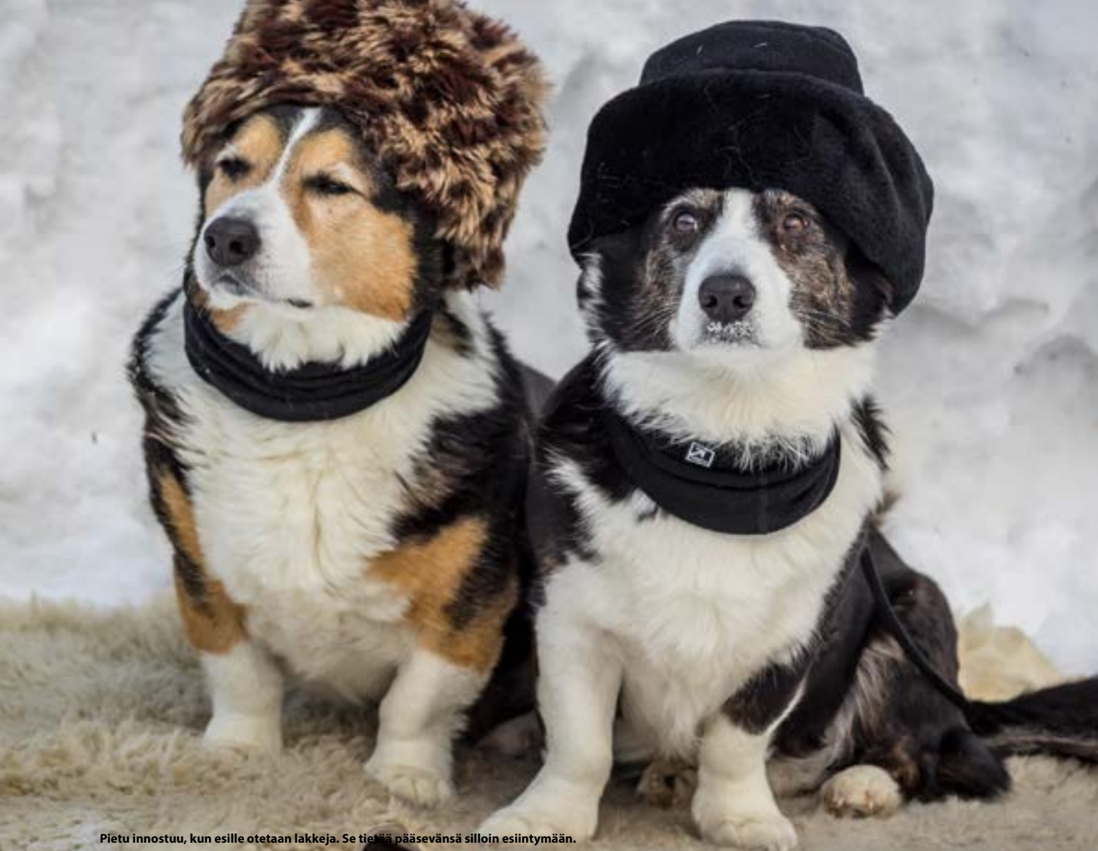
Pietu innostuu, kun esille otetaan lakkeja. Se tietää pääsevänsä silloin esiintymään.